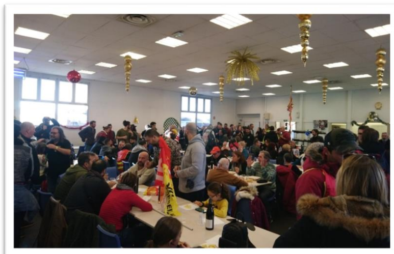
Noël des luttes à Marseille

Nombre de nos concitoyens, notamment les retraités, dans le cadre de leur soutien à l'action, souhaitent apporter une aide financière aux grévistes pour leur permettre de poursuivre le combat. La CGT appelle à constituer des caisses de solidarité locales afin de venir en aide de manière réactive aux cheminots grévistes en difficulté.