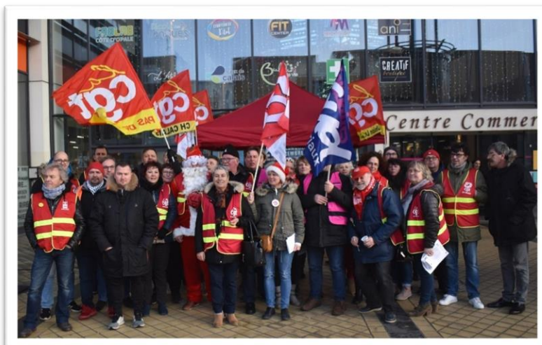
Noël des luttes à Calais – DR.

Pour celles et ceux qui v sont soumis : Pensez au dépôt de DII !!!